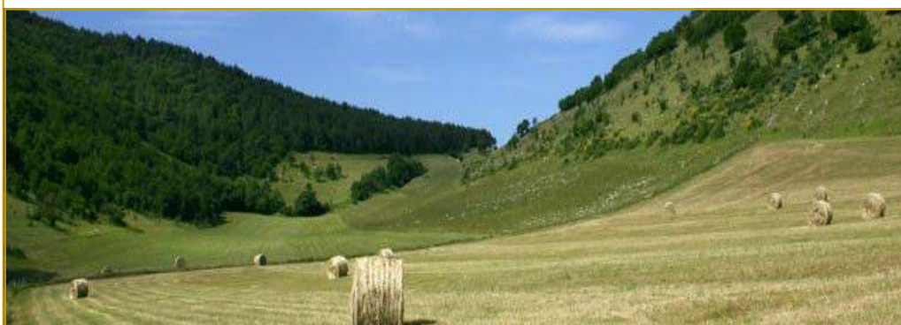
Prateria in alto piano