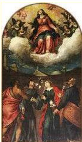
Maria Assunta di Lorenzo Lotto