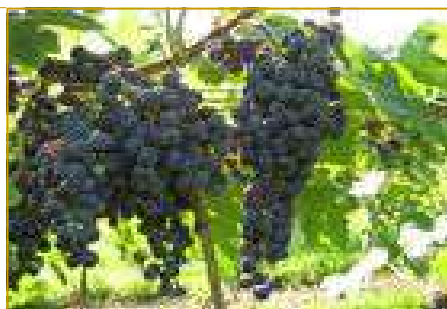
Economia agricola vigneto